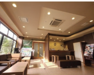
長泉沼津インター第2 ロビー