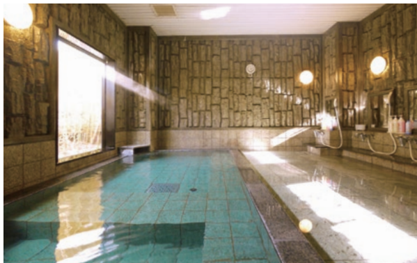
長泉沼津インター第1 大浴場

ホテルルートインが目指すのは、変えることのない日本のこころ。こだわりのおもてなしで、一人ひとりのお客様をお迎えます。