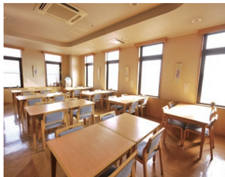
長泉沼津インター第1 レストラン

ビジネスや観光で疲れた体は、活性石人工温泉の大浴場でゆったりと癒していただくことができます。広々としたお風呂で手足を伸ばし、思う存分おくつろぎください。