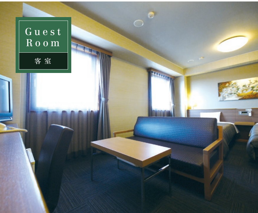
長泉沼津インター第2 客室