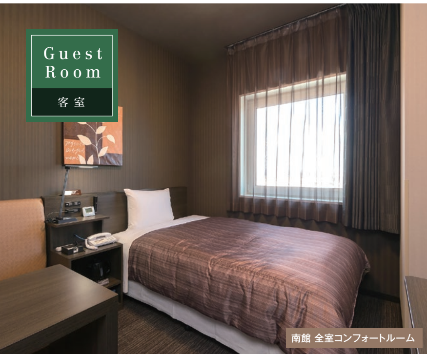
南館 全室コンフォートルーム