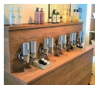
シャワーバー（※女性浴場限定）

ホテルルートインが目指すのは、変わることのない日本のこころ。こだわりのおもてなしで、一人ひとりのお客様をお迎えます。